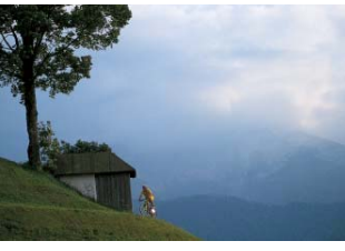
Stimmungsvoller Ausblick auf die Berchtesgadener Berge