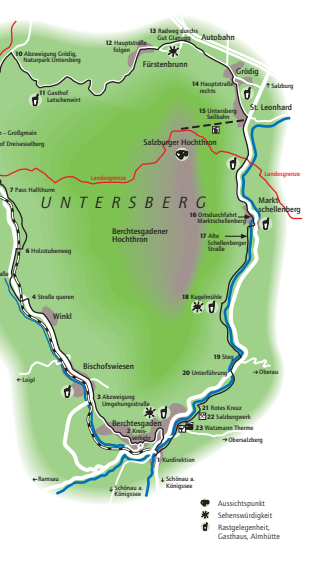
Rund um den Unterberg

30 Dachsen Tour Bischofswiesen - Schwarzack 31 Panorama Schönau a. Königssee - Kühroint 32 Geschichte erleben Berchtesgaden - Kehlstein - Roßfeld 33 Echo Berchtesgaden - Gotzenalm