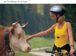
Auf fuchlung mit der Natur