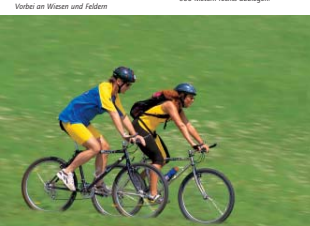
Vorbei an Wiesen und Feldern

Streckenlänge: 50,4 km Höhenunterschied: 300 m Fahrzeit: ca. 3-4 h Ein leichtes Tour bei der man allerdings viel Staetisch benoetigt.