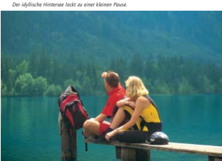
Der idyllische Hintersee lockt zu einer kleinen Pause

Streckenlänge: 55,3 km Höhenunterschied: 868 m Fahrzeit: ca. 4-6 h Variantenreiche Strecke, abends Terrain zum gemeinsamen dahlhellen sowie stalle, schwebelnde Steigungen.